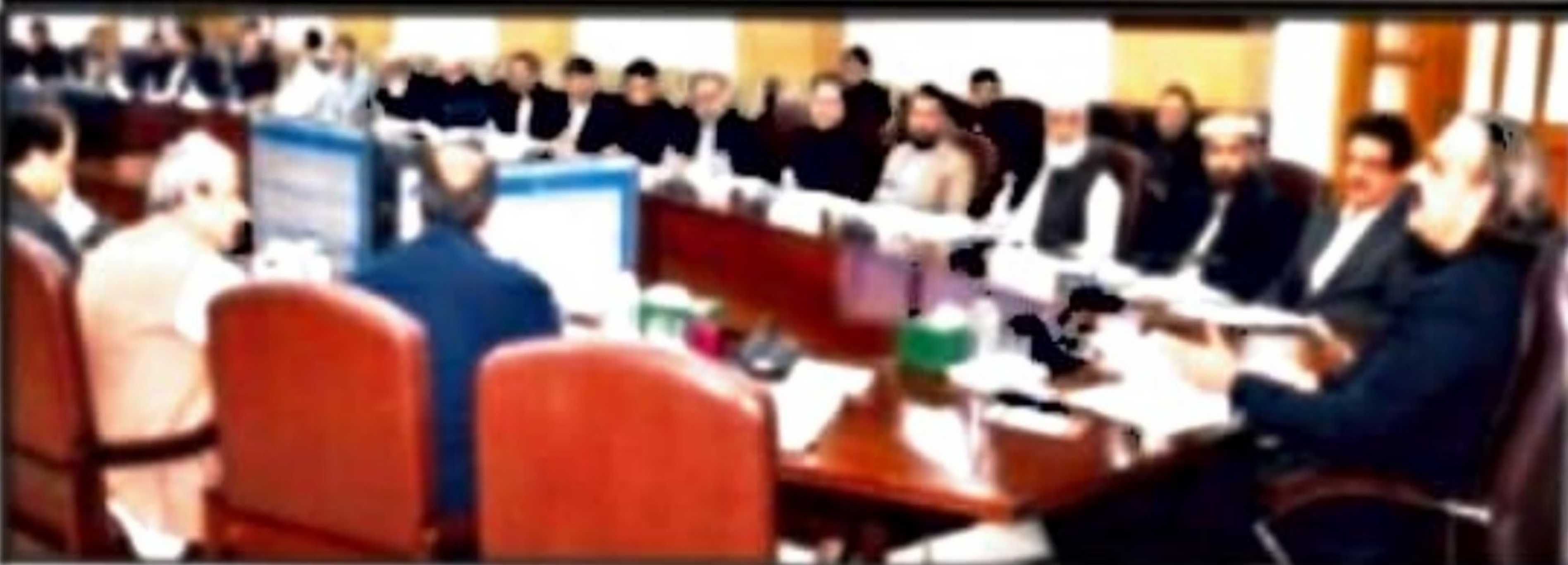
پتھریپ پبلیشرز اسلام آباد کی مجلس کی صورت میں ہے